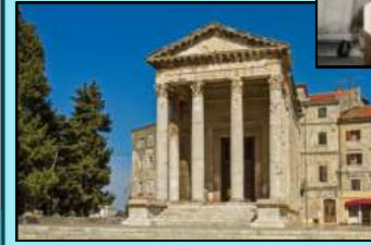
Tempel des Augustus in Pula (Kroatien)