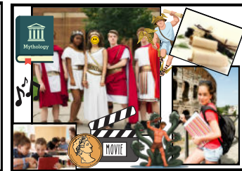
Was ich wirklich mache!

Dieses krasse Meme zeigt Dir, dass es viele Vorstellungen über den Lateinunterricht gibt. In diesem Flyer werden Dir und Deinen Eltern die verschiedenen Facetten der lateinischen Sprache gezeigt. Am Ende der Seiten findest Du QR-Codes. Es warten spannende Rätsel auf dich. Los geht's!