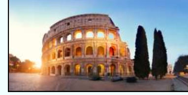
Kolosseum in Rom

Die „Erdmännchen“ lösen einen Kriminalfall im antiken Rom: Schülerinnen und Schüler gewannen mit diesem Film beim Bundeswettbewerb Fremdsprachen einen Preis.