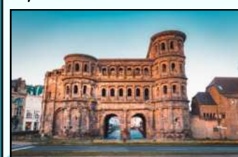
Porta Nigra in Trier

Du kannst auch heute an vielen Orten in Europa auf den Spuren der Römer wandeln.