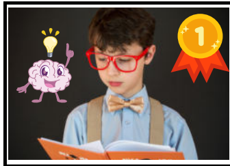
Was meine Freunde denken.