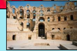
Thysdrus/ El Djem, Tunesien.