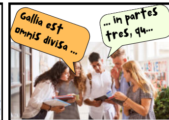
Was Leute denken.